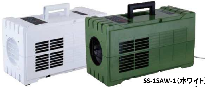
SS-1SAW-1(ホワイト) SS-1SAG-1(モスグリーン)